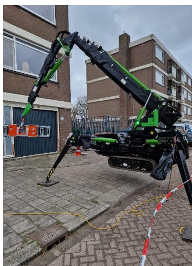
De spinkraan voor het glas.