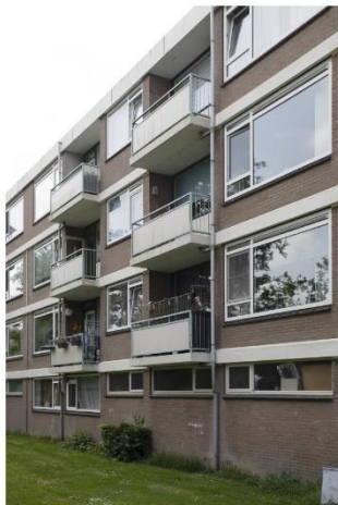
Oude uitstraling gevel

Deze vergoeding ontvangt u na uitvoering van de werkzaamheden in uw woning en na het ondertekenen van het formulier van de definitieve oplevering. Iedereen ontvangt hetzelfde vaste bedrag aan vergoedingen. U ontvangt dus in totaal een bedrag van €420,00. Staat u onder bewind? Dan kunt u het beste contact opnemen met uw bewindvoerder.