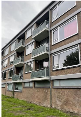
Nieuwe uitstraling gevel